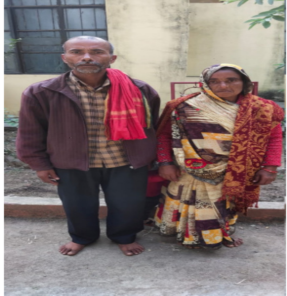
गिरफ्तारी हेतु चलाये जा रहे अभियान के क्रम में आज थाना